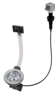
Desagüe automático LIRA 8407 103