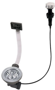
Desagüe automático 8407 100